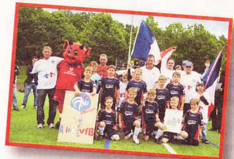
Im kleinen Finale unterlegen – der VfB Gisingen.