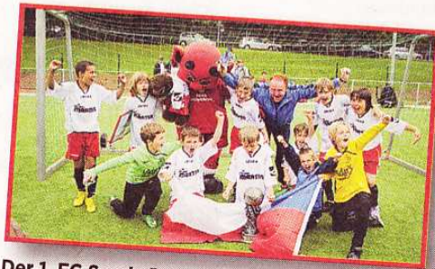
Der 1. FC Saarbrücken sicherte sich den Titel.