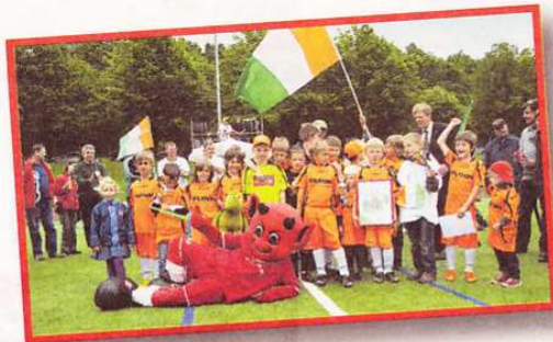
Platz 3 belegten die Sportfreunde Rehlingen.