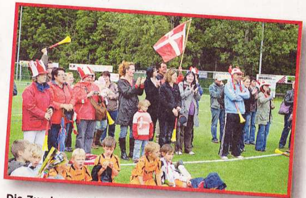
Die Zuschauerresonanz bei der AOK Saarland WM 2010 waren riesengroß. Mit Vuvuzelas, Tröten, Sprechchören und einem Fahnenmeer wurden die Nachwuchskicker angefeuert.