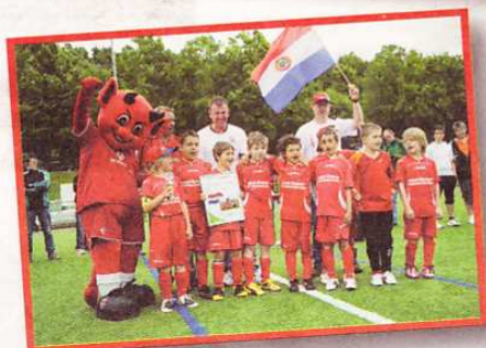
Die Kicker des SV Rohrbach belegten den 7. Platz.