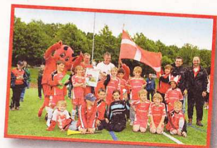
Platz 8 für die JSG Scheuern/Überroth.