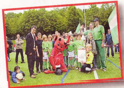
Der FV Püttlingen musste sich mit dem Vize-WM-Titel begnügen.