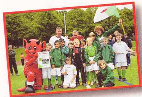
Der SSV Pachten belegte bei der Mini-WM den 6. Platz.