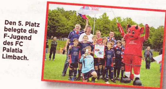
Den 5. Platz belegte die F-Jugend des FC Palatia Limbach.